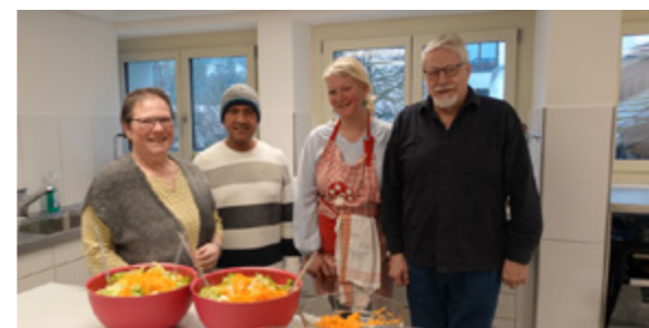
Sie haben für das leibliche Wohl gesorgt...

Das jüngste Kind der ökumenischen Zusammenarbeit zwischen katholischer und reformierter Kirche Brugg ist erfolgreich ins Leben gestartet. So gab es beim offenen Mittagstisch am Freitag, 1. März sowohl bei den zahlreichen Gästen als auch bei den Freiwilligen und Verantwortlichen nur zufriedene Gesichter.